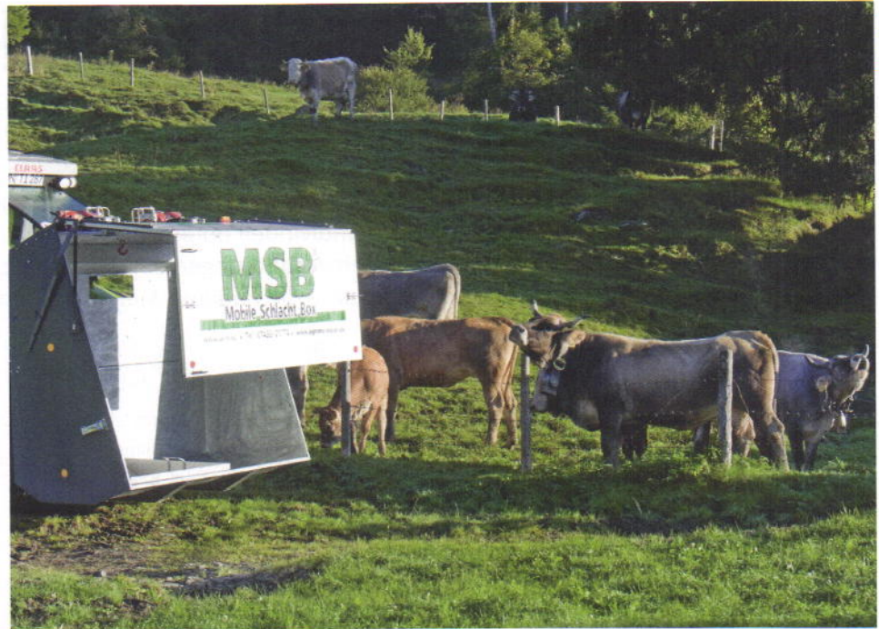
Die mobile Schlachtbox steht bereit. Sobald das Rind auf der Weide betäubt ist, wird es in dieser Box nach geltenden Hygienestandards getötet.

Der Fachexperte beim BVET bezweifelt auch, dass die Tiere zeitgerecht entblutet und ausgenommen werden können. Zwischen dem Betäuben und Töten dürfen nach geltendem Schweizer Recht maximal 60 Sekunden verstreichen, damit das Tier bei der Schlachtung sicher bewusstlos ist. Agronomin Lea Trampenau hält der Kritik des BVET entgegen: «Die Zeit ist nicht der einzige Faktor - es kommt auf die Tiefe der Betäubung an.» Da der Kugelschuss aus kurzer Distanz - im Gegensatz zum Bolzenschuss - das Tier viel tiefer betäube und in vielen Fällen sogar